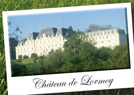
Château de Lormoy

Parcours nature chronométrés Limités à 300 dossards Contact : la.longipontaine@gmail.com